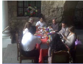
Las reuniones se realizan todos los días martes en el Hotel Posada de Don Rodrigo

Actualmente el C.A.T. está conformado por Cámara