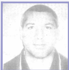
Fotografía del ladrón que se hace pasar por huésped